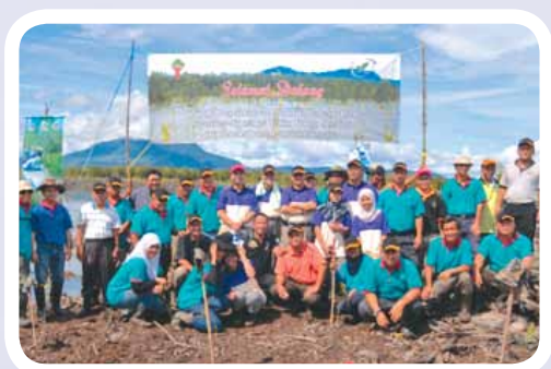
Lawatan Tapak Dan Aktiviti Penanaman Sempena Mesyuarat JKTB Bil. 6/2010 Di Kuching, Sarawak