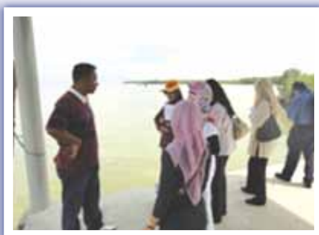
Lawatan Jawatankuasa Penilaian Teknikal Yang Dianggotai Oleh Pegawai-Pegawai NRE, NAHRIM, JPS, FRIM dan JPSP