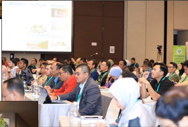
SEBAHAGIAN DARIPADA PESERTA