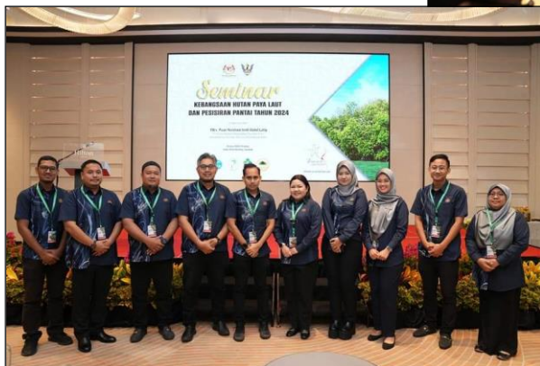
BARISAN URUSETIA / AJK