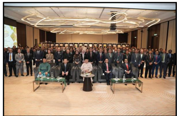
Gambar 3 & 4: Ucapan Perasmian Sambutan Hari Konservasi Ekosistem Hutan Paya Laut Antarabangsa Peringkat Kebangsaan Tahun 2024 oleh YB Datuk Amar Haji Awang Tengah bin Ali Hasan, Timbalan Premier Sarawak dan Sesi Bergambar Semua Peserta Sambutan