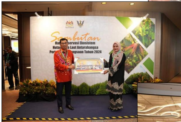
PENGARAH JPN PERAK MEMBERIKAN CENDERAMATA