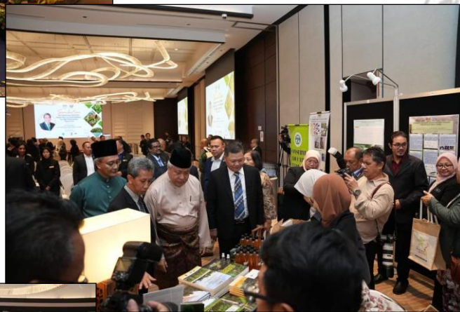
LAWATAN TPS SARAWAK KE PAMERAN POSTER