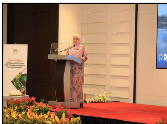
Gambar 1: Ucaptama Seminar Kebangsaan Hutan Paya Laut

Semasa sesi pembentangan kertas kerja, sebanyak enam (6) soalan telah dikemukakan antaranya berkaitan dengan cadangan destinasi ekopelancongan kelip-kelip untuk tujuan eko-pelancongan, kepentingan dalam mempertimbangkan tempoh pemulihan dalam program pemuliharaan hutan paya bakau, langkah mitigasi seperti "Nature Based Solutin (NBS)" bagi kawasan yang terhakis teruk, penggunaan pemecah ombak dalam melindungi anak pokok bakau melalui kaedah penggunaan Analisa Pekali Seretan CFD dan lain-lain. Laporan terperinci penganjuran seminar adalah sepertimana pada perkara 11.0 manakala teks ucaptama bagi penganjuran seminar ini adalah seperti di Lampiran 1 .