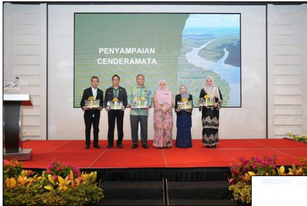
TKSU, NRES BERGAMBAR BERSAMA PEMBENTANG DAN PENERUSI SESI SATU