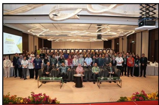
Gambar 2: Peserta Seminar Kebangsaan Hutan Paya Laut dan Pesisiran