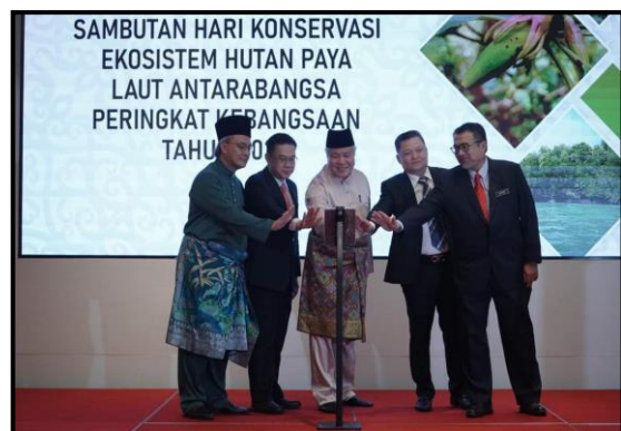
Gambar 5 & 6: Gimik & Tayangan Montaj Sambutan Hari Konservasi Ekosistem Hutan Paya Laut Antarabangsa Peringkat Kebangsaan Tahun 2024 dan Peluncuran Buku Status of Mangroves in Malaysia